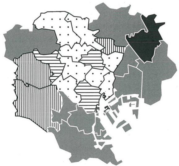
東京23区における避難所収容数の不足状況 [避難所の耐震化の現状を考慮した場合]