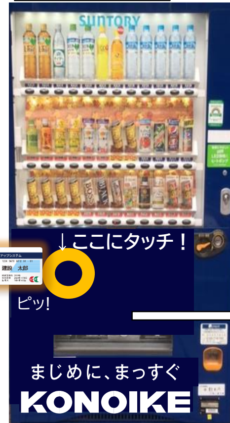
自動販売機設置例