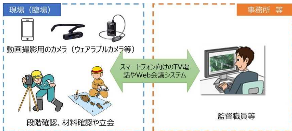
図 2-1 機器構成（例）