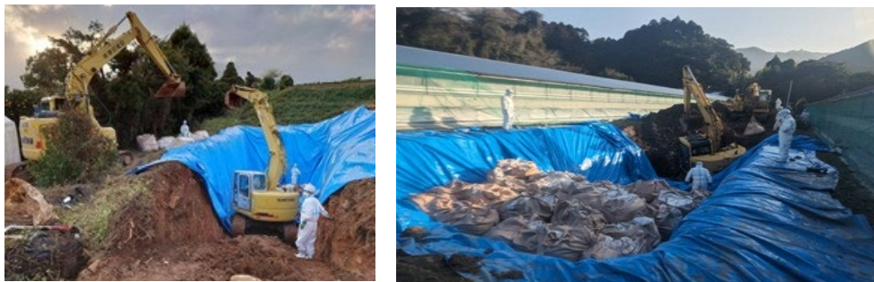
(一社) 鹿児島県建設業協会 (令和5年12月、令和6年2月)