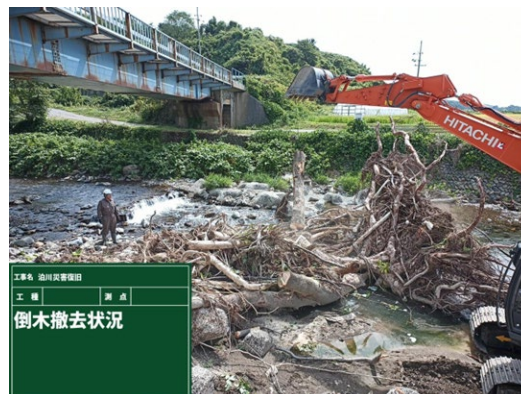
はつぼうちょうとまりがわ 八峰町泊川における倒木撤去作業 (7月の前線による豪雨) (一社) 秋田県建設業協会