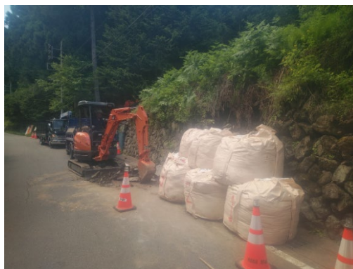
かいしょうおにし 県道会場鬼石線 応急土嚢設置作業 (6月の大雨・台風2号による豪雨) (一社) 群馬県建設業協会