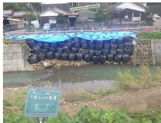
つきのかわがわ 調川川の堤防決壊に伴う土嚢設置作業 (9月の豪雨) (一社) 長崎県建設業協会