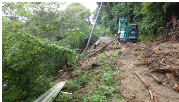
みずぬまいそはら 県道水沼磯原線の土砂流出に伴う応急復旧作業 (9月の台風13号による豪雨) (一社) 茨城県建設業協会