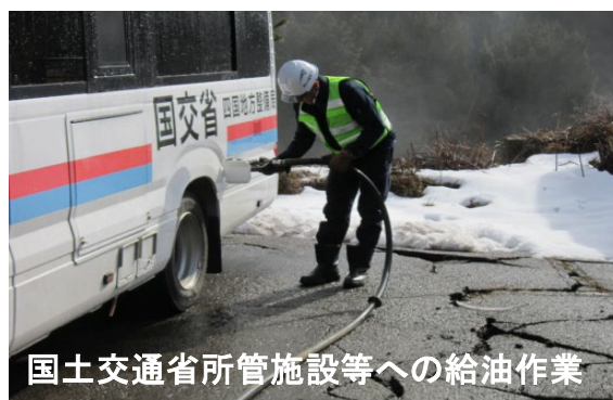
国土交通省所管施設等への給油作業