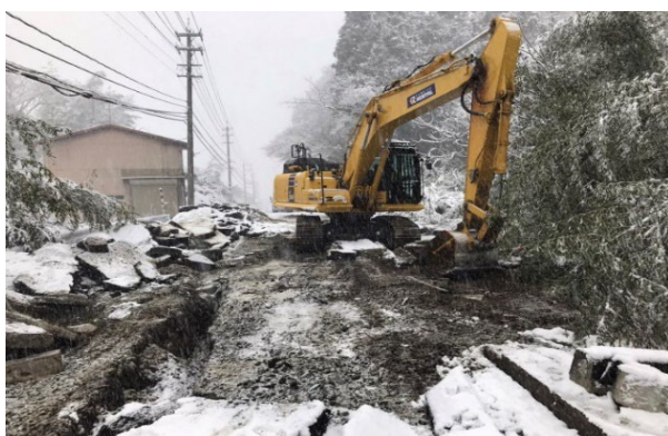
ほうすぐんのとちょうみやいぬ 鳳珠郡能登町宮犬地内（1月13日）