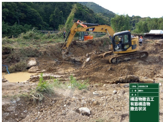
あわのがわ 大雨による粟野川の応急復旧作業 (7月の豪雨) (一社) 山口県建設業協会