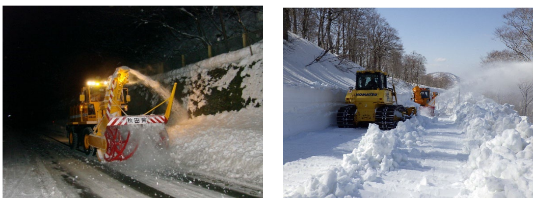
(一社) 秋田県建設業協会