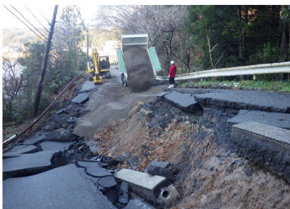
ほうすぐんあなみずましかわしり 鳳珠郡穴水町川尻地内（1月11日）