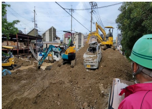
てんじんがわ 天神川氾濫に伴う流出堆積土砂撤去作業 (5月の豪雨) (一社) 兵庫県建設業協会