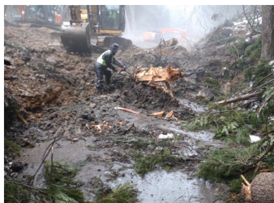
もんぜんまちふたまたがわ 輪島市門前町二又川地内（1月18日）