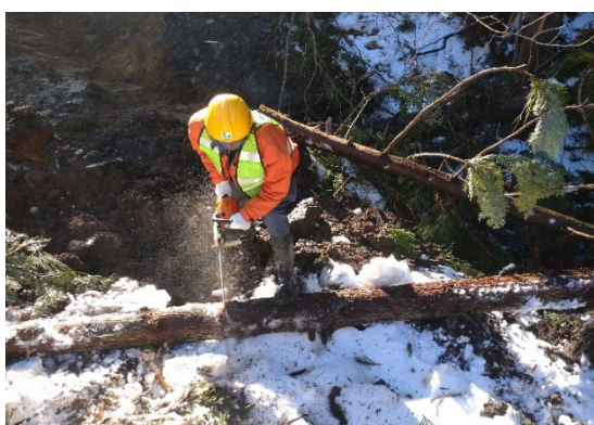
もんぜんまちふたまたがわ 輪島市門前町二又川地内（1月17日）