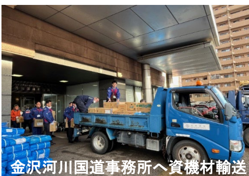
金沢河川国道事務所へ資機材輸送