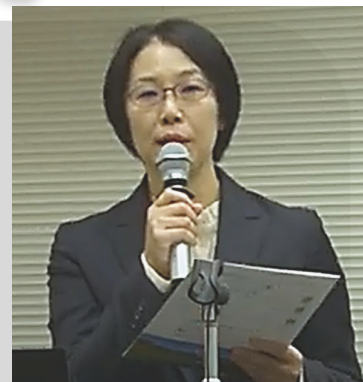
官民ジョブサイト 担当者

実は近年の人材市場の変化は顕著だと感じていますね。人事担当の方に「45歳以上の中堅・シニア層」と説明すると、以前は年齢だけでNGという反応も珍しくなかったのですが、最近では「 専門性や強みを持つ人材なら年齢は問わない 」と言われることが増えてきました。